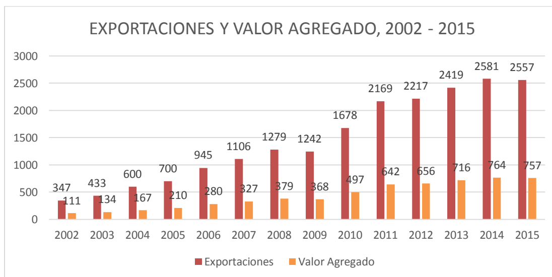
Gráfico: Exportaciones y Valor Agregado, 2002-2015